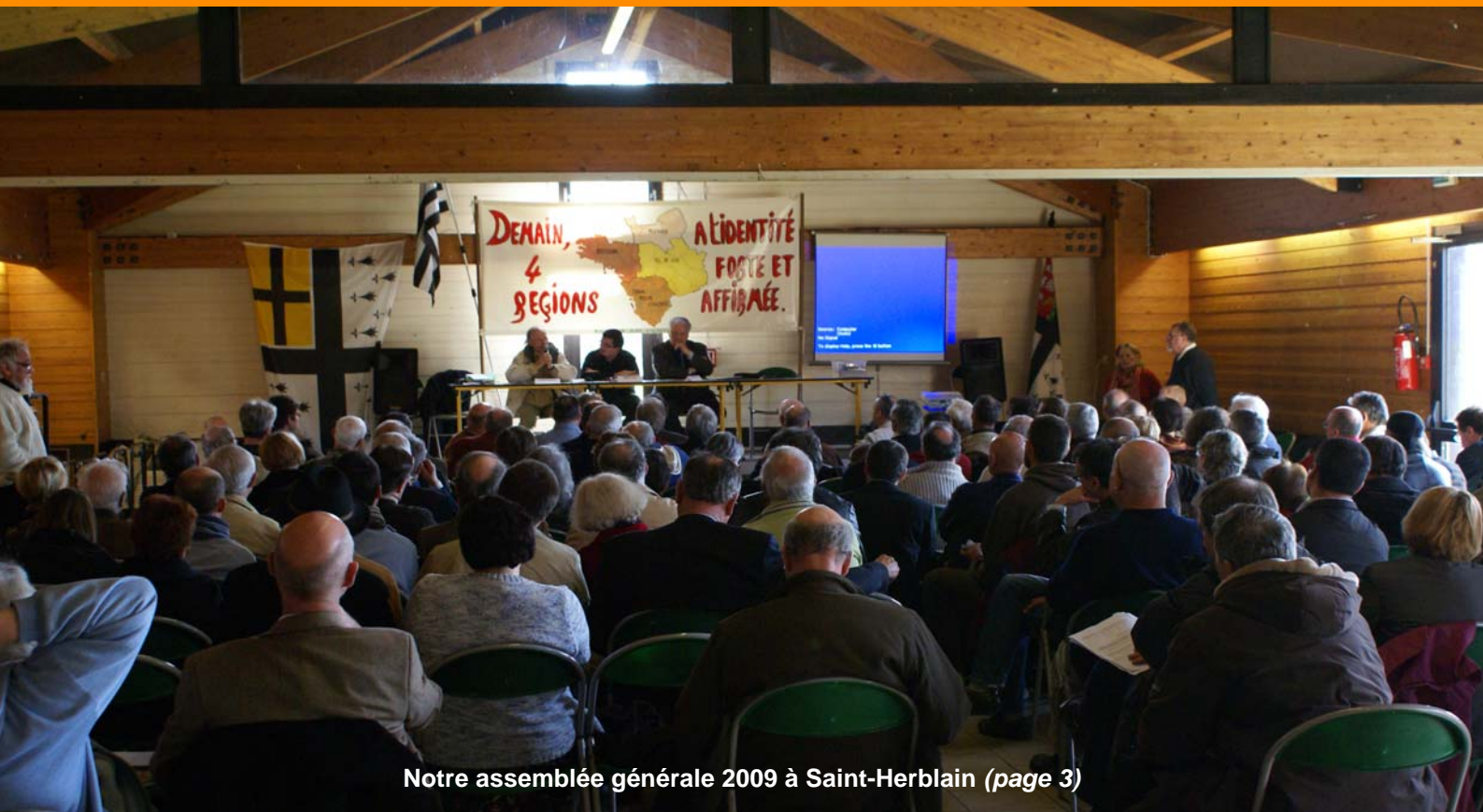
Notre assemblée générale 2009 à Saint-Herblain (page 3)